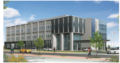
新弘前地域研究所完成予想図

今般、本事業の第2回目、平成26年度成果報告会を開催いたしますので、多くの方々に、ぜひご参加いただきますよう、ここに御案内申し上げます。