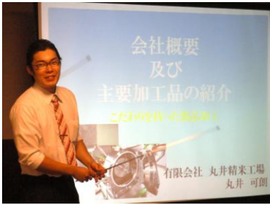
弘前会場の丸井精米工場(十和田市)。最新の湿式製粉の特性などを説明

☆☆☆ 燃える若者たちの意欲。パワーポイントを使い、自社の強みを自分の言葉で表現 ☆☆☆