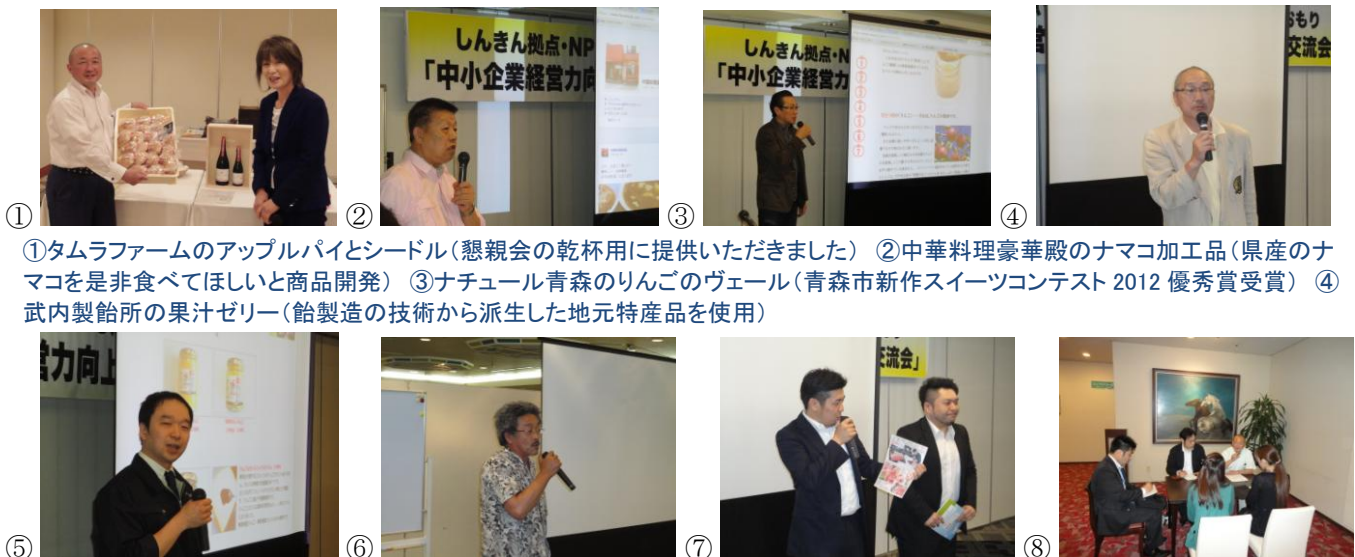
①タムラファームのアップルパイとシードル(懇親会の乾杯用に提供いただきました) ②中華料理豪華殿のナマコ加工品(県産のナマコを是非食べてほしいと商品開発) ③ナチュラル青森のりんごのヴェール(青森市新作スイーツコンテスト 2012 優秀賞受賞) ④武内製菓所の果汁ゼリー(飴製造の技術から派生した地元特産品を使用)